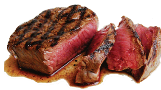
La comida ya está lista... ¡A la mesa!