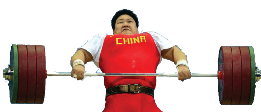
¡No puedo, no puedo...!