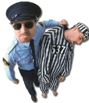
Quiero un abogado...