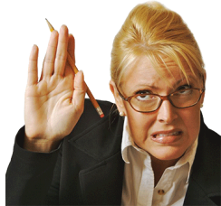
Yo, yo creo que sé la respuesta...