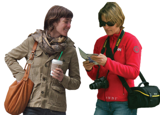
Estamos en la plaza Mayor...