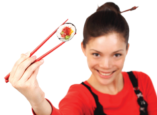
¿Está rico eso?