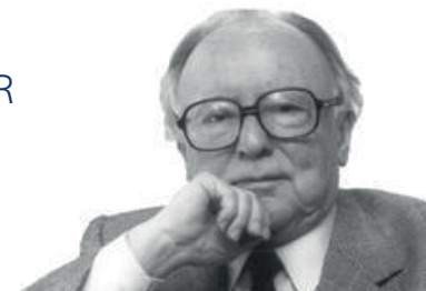
Augusto Monterroso (Honduras, 1921 – México 2003)

PRIMERO. Cuando tengas algo que decir, dilo (1); cuando no, también. Escribe siempre.