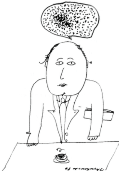
El espejo que no podía dormir

Había una vez (1) un espejo de mano que cuando se quedaba solo (2) y nadie se veía en él se sentía de lo peor, como que no existía (3), y quizá (4) tenía razón; pero los otros espejos se burlaban de él, y cuando por las noches (5) los guardaban en el mismo cajón del tocador dormían a pierna suelta satisfechos, ajenos a la preocupación del neurótico.