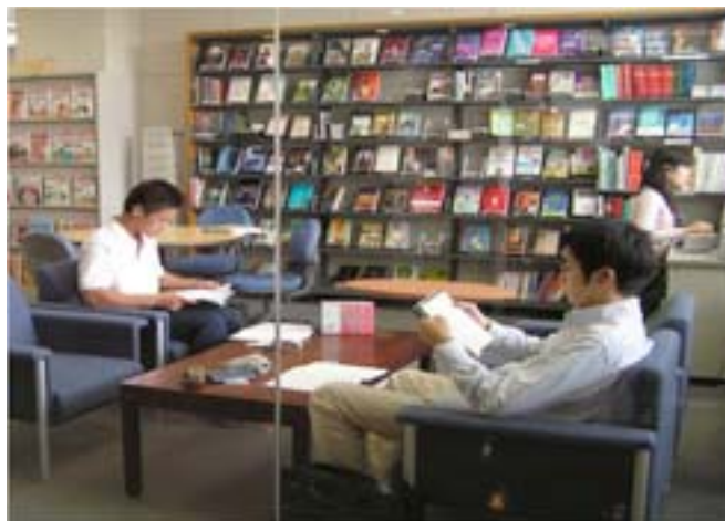
FIGURA 1. CENTRO DE AUTOAPRENDIZAJE DE LA AKITA INTERNATIONAL UNIVERSITY

El curso tiene lugar en el Centro de Autoaprendizaje durante tres horas semanales a lo largo de un periodo de quince semanas (un semestre).