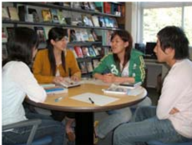
FIGURA 2. COMPARTIENDO IDEAS

El Centro está dotado de ordenadores personales, una nutrida biblioteca de libros y publicaciones periódicas, DVDs de películas y series de televisión famosas (como Friends , Full House , Discovery Channel ), revistas sobre temas de actualidad, acompañadas de grabaciones de entrevistas y noticias en formato minidisc , y una biblioteca con diccionarios, enciclopedias y materiales sobre técnicas de estudio. Mientras los estudiantes trabajan en sus programas de aprendizaje individuales, se les anima a que hablen con sus compañeros y con el profesor sobre los materiales que han seleccionado y las estrategias que están empleando.