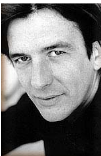
_____ (CHISCO AMADO)