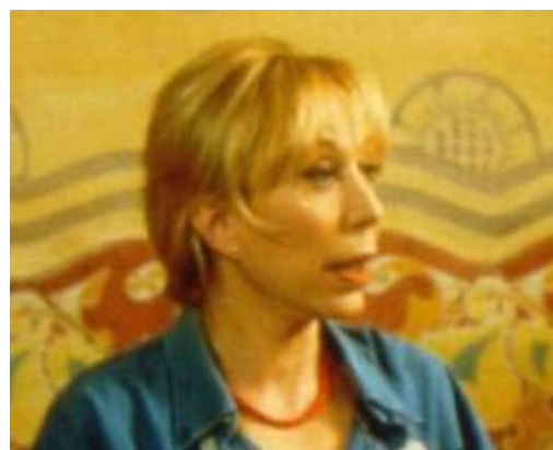
_____ (ROSA MARIA SARDÀ)