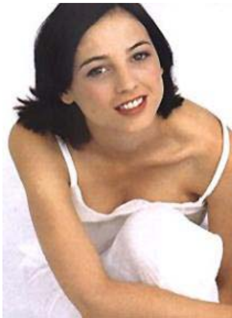
_____ (LEONOR WATLING)

Antes de continuar, vamos a hacer una pausa para recapitular acontecimientos y analizar a los personajes, a quienes ahora ya conocemos mucho mejor. El profesor va a dar a cada grupo una tarjeta con la foto de uno de los personajes. Vuestra tarea consiste en hacer un resumen del carácter del personaje, su forma de ser, sus perspectivas y objetivos en la vida, etc. Después, los miembros de cada grupo se separan y buscan una pareja que pertenezca a otro grupo para exponerle su análisis del personaje; el objetivo de quien escucha es adivinar –al final del análisis– de qué personaje se trata.