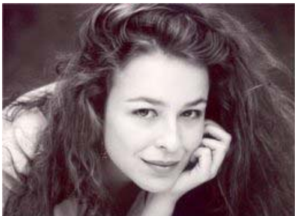
_____ (SILVIA ABASCAL)