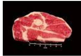
dos chuletas de carne