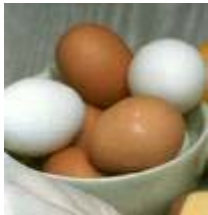
una docena de huevos