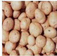
un kilo de patatas