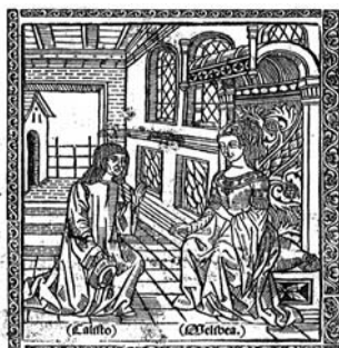
La Tragicomedia de Calisto y Melibea nuevamente aña oiba lo que bafia agni faltava de poner / en el psoocho de sus amores: la qual contiene de mas de fin agradable y bul ce fño muchao sentencias filosofales: y auñao muy neces- farios para maneeboos: mostrando leo los enganos que estan enerrados en feruientes y alcahuetas.

Aquí tienes información sobre la obra y una de sus adaptaciones cinematográficas: