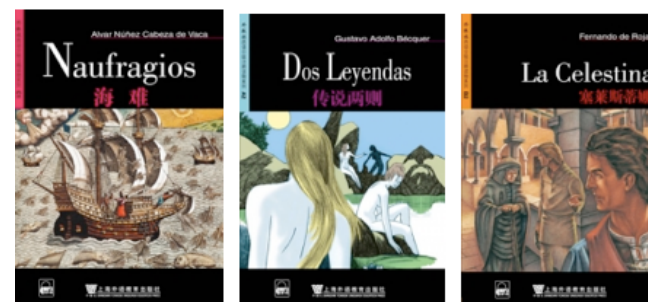
Figura 4: Lecturas para el estudiantes de la especialidad de Español editados por Shanghai Foreign Language Education Press

Una situación análoga a la descrita con respecto a los materiales didácticos podría anotarse en relación al panorama de las obras clásicas de la literatura escrita en español –tanto de las obras traducidas íntegramente al chino como de las adaptaciones para estudiantes de español.