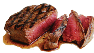
La comida ya está lista... ¡A la mesa!