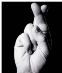
CRUZAR LOS DEDOS