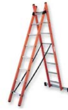
PASAR BAJO ESCALERA