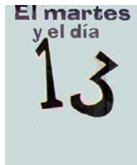
MARTES Y 13