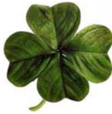
TRÉBOL DE CUATRO HOJAS