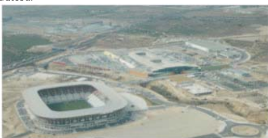
Estadio de fútbol Nueva Condomina