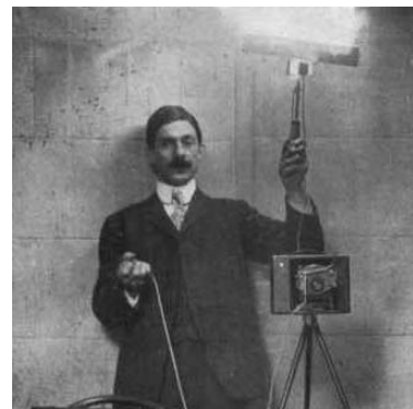
flash antiguo, activado con MAGNESIO