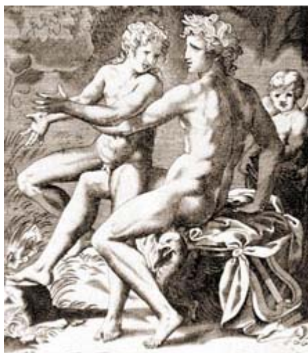
Apolo y Jacinto

Jacinto, el joven hijo del rey de Esparta, tan hermoso como los mismísimos dioses del Monte Olimpo, gozaba del amor de Apolo, arquero. El dios solía bajar por las orillas del río Eurotas, dejando desierto su santuario en Delfos, para pasar tiempo con su joven amigo y deleitarse con los placeres de los jóvenes. Cansado de su música y de su gran arco, Apolo hallaba descanso en pasatiempos sencillos. Ora llevaba a Jacinto a cazar a los bosques y calveros de las laderas de las montañas, ora practicaban gimnasia (una disciplina que posteriormente Jacinto enseñaría a sus amigos y por la que fueron famosos los espartanos). La vida sencilla despertó los apetitos de Apolo, a quien el muchacho de pelo rizado resultó más encantador que nunca. Apolo le entregó su amor sin restricciones, olvidando que se trataba de un simple mortal.